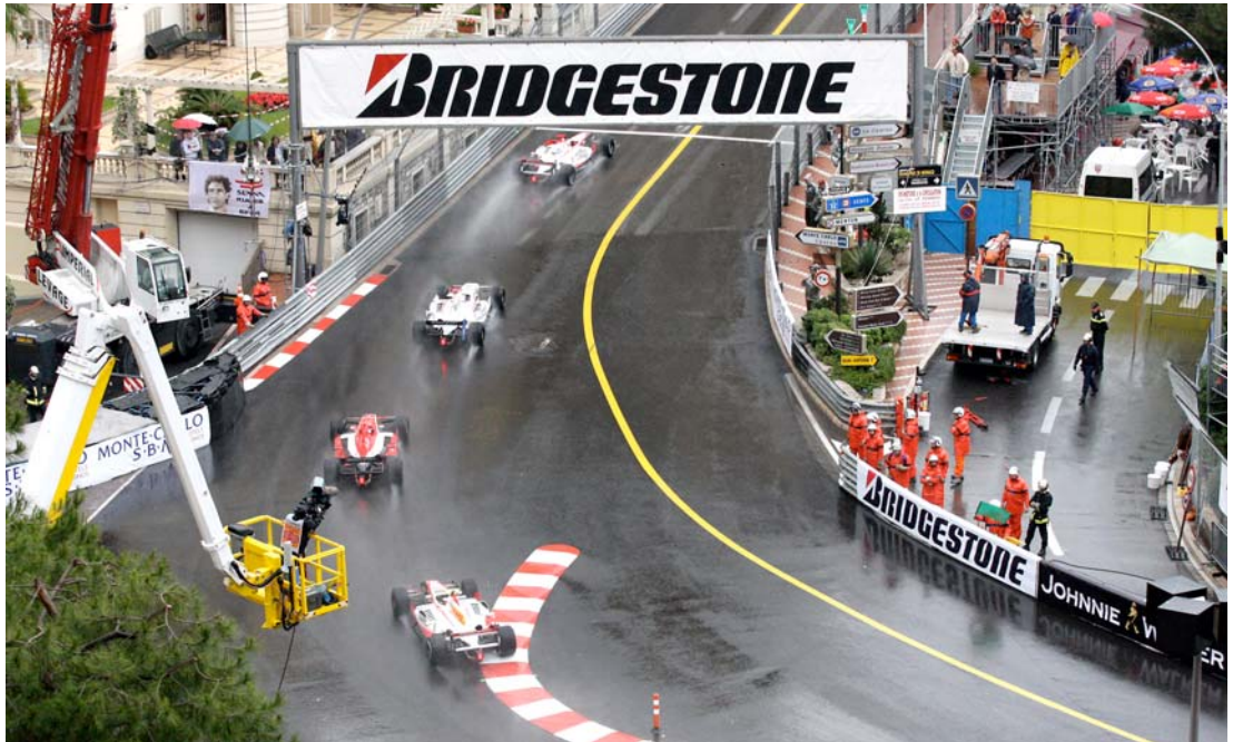
Virage St Dévôte et ligne de départ